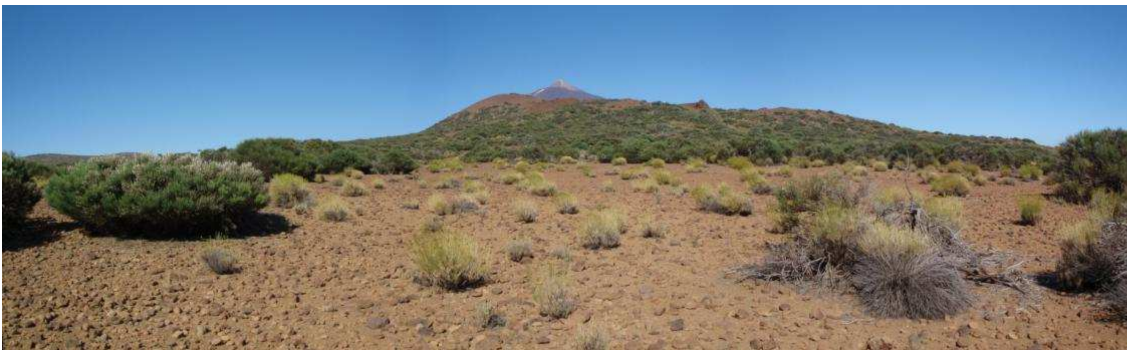
Ilustración 2: Panorámica del Parque Nacional del Teide