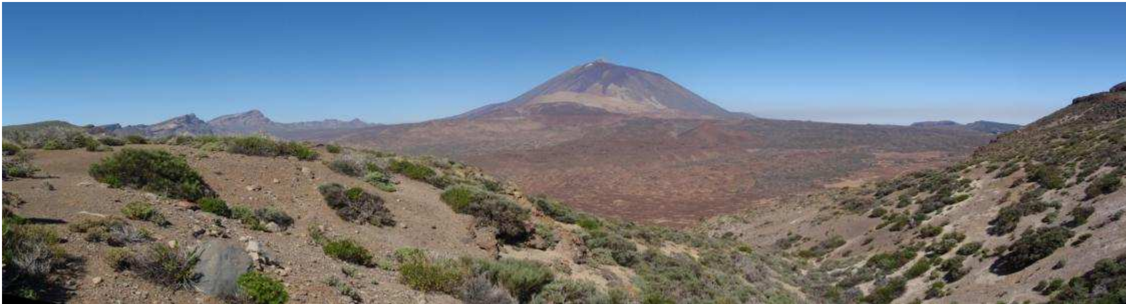
Ilustración 1: Panorámica del Parque Nacional del Teide