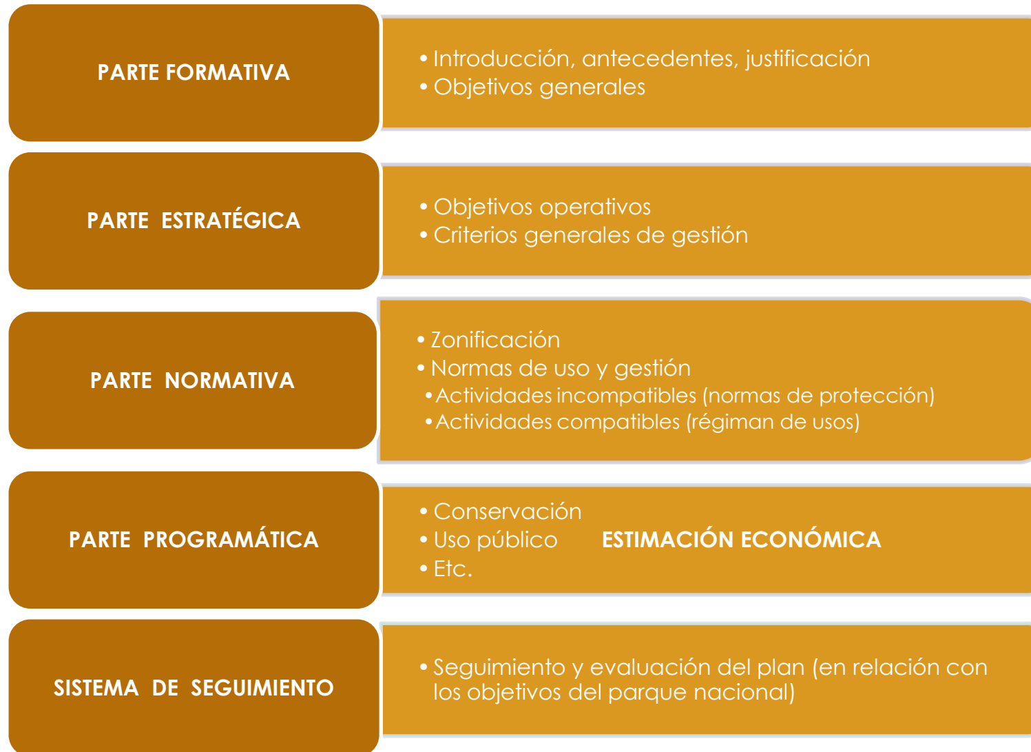
Ilustración 3: Esquema de contenido del PRUG..