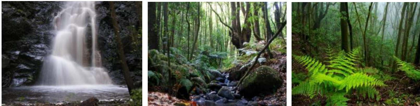
Ilustración 1: Imágenes de Uso Público del Parque Nacional de Garajonay.