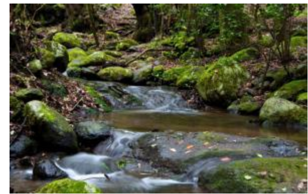
Ilustración 2: Imágenes vinculadas a actuaciones de conservación del Parque Nacional de Garajonay.